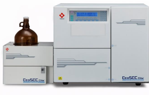
< 高速 GPC 装置 HLC®-8420GPC >